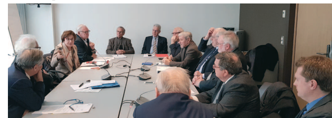
Réunion de la Commission Europe et géopolitique en 2018

La participation à l'association européenne des anciens parlementaires des pays membres du conseil de l'Europe