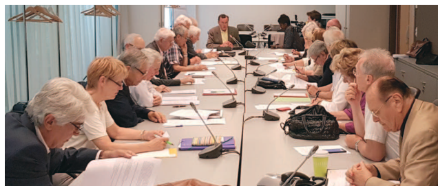
Réunion du Comité Directeur en Juin 2018

L' ouverture d'esprit est illustrée par la diversité des engagements politiques de ses membres issus de tous les bancs de l'Assemblée. Elle s'exprime à travers les thèmes et les centres d'intérêt traités par le Groupe.