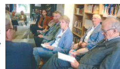
Alliance française en Macédoine